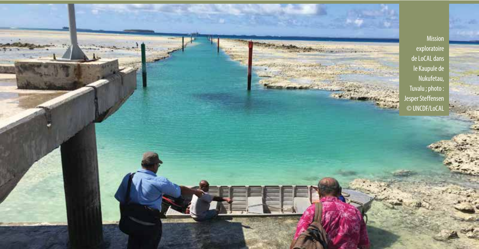
Mission exploratoire de LoCAL dans le Kaupule de Nukufetau, Tuvalu ; photo : Jesper Steffensen © UNCDF/LoCAL

ressources pour la phase II. Pendant ce temps, la Tanzanie et Tuvalu recevront et mettront en œuvre leurs premières SRCBP. La conception des projets au Lesotho et en Ouganda sera finalisée en 2017, ce qui permettra à 1,2 millions de personnes dans le besoin de bénéficier de ce nouveau type d'accès au financement climatique et des investissements d'adaptation qui en découlent. D'autres PMA ont exprimé leur intérêt et se préparent à rejoindre LoCAL, car il leur offre un mécanisme éprouvé et évolutif pour acheminer efficacement et de façon transparente les financements climatiques pour le bénéfice des populations les plus vulnérables.