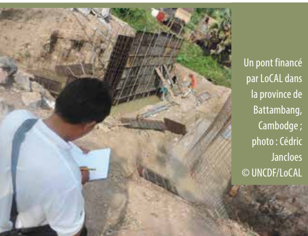
Un pont financé par LoCAL dans la province de Battambang, Cambodge

Lorsque le dispositif aura été étendu au niveau national dans ces 12 pays, LoCAL bénéficiera à plus de 350 millions de personnes.